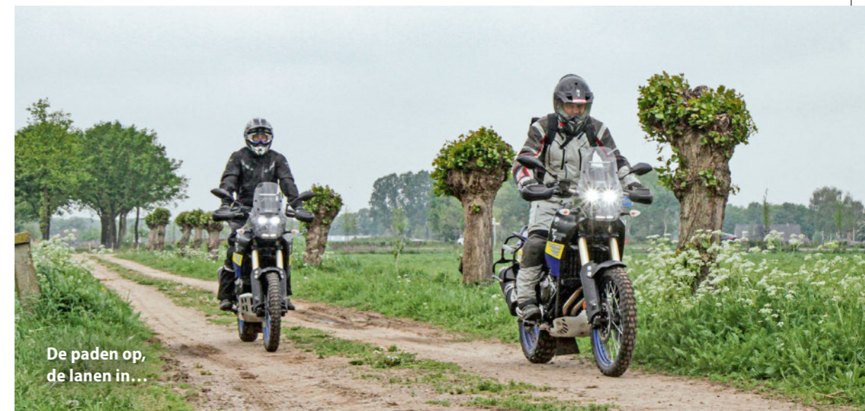
De paden op, de lanen in...

Als MotoPlus op een maandag in mei meerrijdt in de Yamaha T700 Ténéré Adventure Tour, begint de dag fris en zelfs met een beetje miezerregen. Gelukkig klaart het in de loop van de ochtend op en rijden we 's middags in een stralend zonnetje bij een graad of 18. Eigenlijk kon het weer niet beter, want die grijze regenachtige ochtenduren hebben de meeste wandelaars en fietsers op andere gedachten gebracht: die zijn lekker thuisgebleven, zodat we ons op de bospaden en gravelwegen af en toe 'alleen op de wereld' voelen. Met hooguit wat aspergestekers op het land of boeren die hun akkers aan het inzaaien zijn. De wandelaars, fietsers en ruiters die we nog wel tegenkomen lijken trouwens in goede stemming en zwaaien vrijwel allemaal vriendelijk terug. De stille uitlaten van de Ténéré's en onze aangepaste rijstijl (even van het gas af als je ze tegenkomt of inhaalt) kweekt duidelijk veel goodwill. We zien er ook niet uit als heftige, herrieschopende wildcrossers en bovendien blijkt hier in Brabant en Limburg leven en laten leven gelukkig een aangeboren karaktertrek te zijn. Vanuit Volkel rijden we 's ochtends oostwaarts, om bij Gennep de Maas over te steken en vandaaruit – via openbare wegen en paden – langs de rivier en door een mooi bosgebied naar het zuiden te rijden. We passeren de Hertog Jan-bierbrouwerij in Arcen en bereiken zo de veerpont Arcen-Broekhuizen. Normaal gesproken