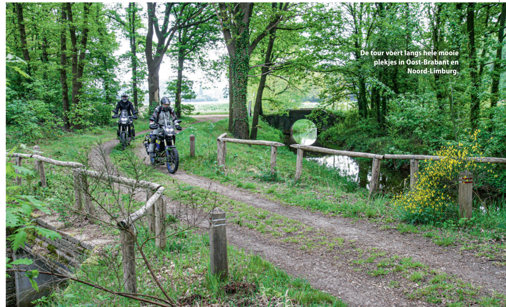
De tour voert langs hele mooie plekjes in Oost-Brabant en Noord-Limburg.

Vanaf Meerlo rijden we met een grote boog om Venray weer westwaarts, richting thuisbasis Volkel. Als we de Noord-Limburgse Maas weer achter ons laten, verandert ook de bodemgesteldheid: in Brabant rijden we wat meer op echte zandpaden. Dat vraagt ook meer rijvaardigheid: door de droogte zijn veel paden behoorlijk los en mul en dan geldt het devies: gewicht naar achteren om het voorwiel te ontlasten en het gas open houden. Zolang je het tweecilinderblok maar kunt later trekken, snijdt de voorband als vanzelf door het zand en ga je probleem-