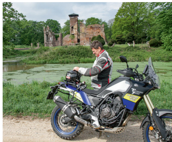
Even uitblazen en het vizier schoonmaken bij de ruïne van een vervallen landhuis net voor Arcen.