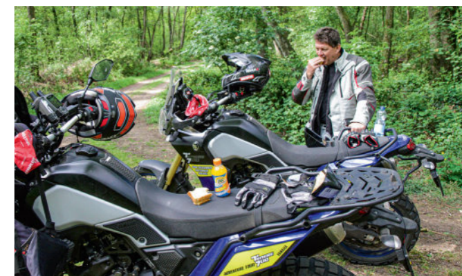
Een overheerlijke allroad-lunch: een broodje van de pomp opeten midden in het bos.