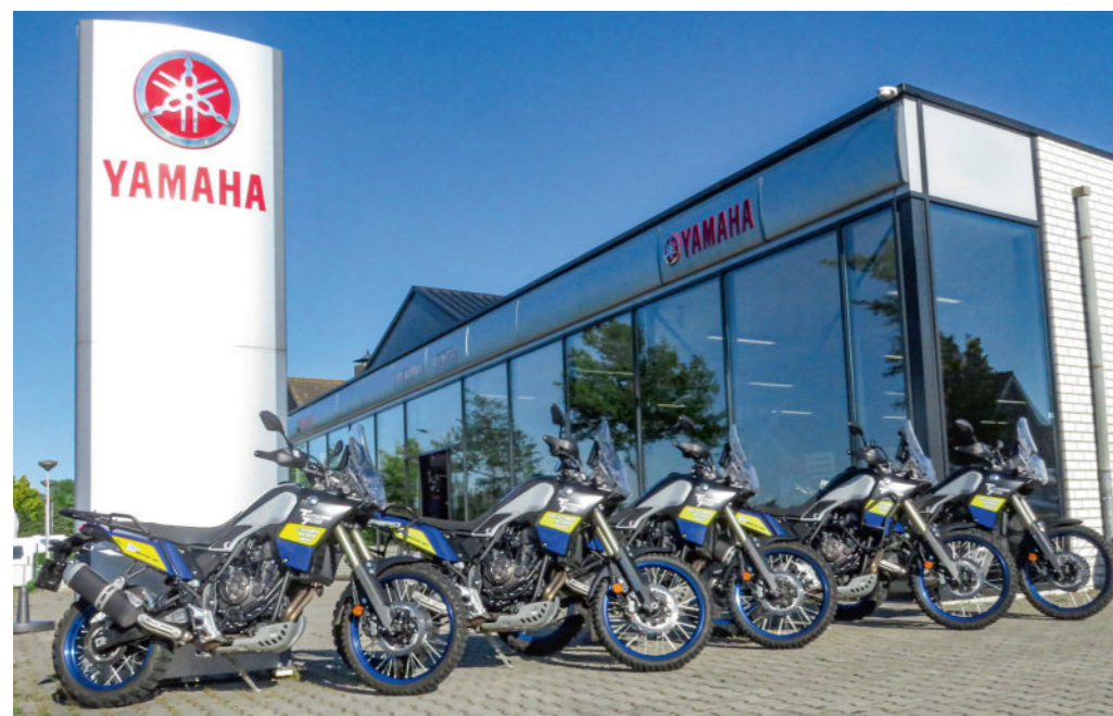
Yamaha exclusiefdealer Van Sleuwen Motoren in Volkel heeft vijf nieuwe T700 Ténéré's klaar staan voor de gegidste dagtochten.

Tja, wie droomt er niet van om in het Frans-Italiaanse grensgebied onverharde bergpassen en oude militaire gravelwegen te rijden, zoals MotoPlus vorig jaar deed met de uitgebreide allroad-test op de Col du Sommeiller (zie nr. 22/2019). Of met je allroad met volle aluminium koffers in het Marokkaanse Erfoud aan de rand van de Sahara te staan. Of ooit een sabbatical te nemen en dan de hele Trans Euro Trail (TET) allroad-route door Europa na te rijden. Maar de harde werkelijkheid is dat dat soort plannen voorlopig vanwege het corona-virus in de ijskast gezet moeten worden, maar gelukkig is er ook in