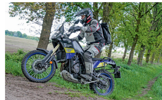
De gids kan de route eenvoudig aanpassen aan de rijcapaciteiten van de groep die achter hem aanrijdt.