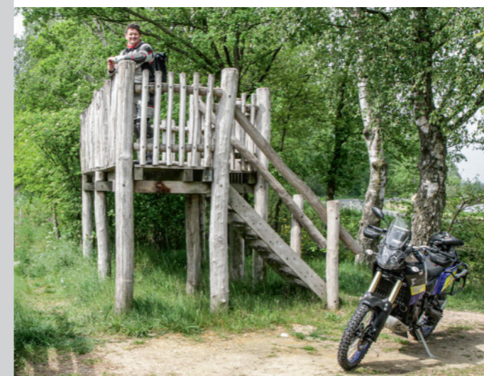
Even genieten van het uitzicht: zo'n prachtige Yamaha T700 Ténéré.

Meer info op: www.vansleuwenmotoren.nl of www.allroadtours.nl