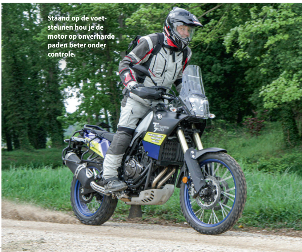
Staan op de voetsteunen hou je de motor op onverharde paden beter onder controle.