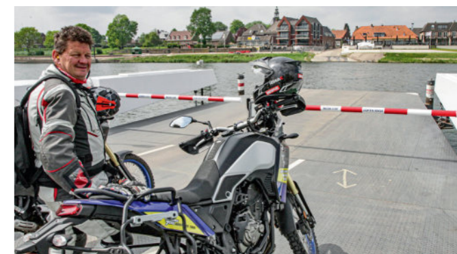
Schipper mag ik overvaren... Met de veerpont van Arcen naar Broekhuizen steken we de Maas weer over.

Langs de westelijke oever van de Maas rijden we weer iets omhoog door het lieflijke Limburgse landschap. Normaal gesproken wordt hier ergens gestopt om op een terrasje te lunchen, maar in deze coronatijd kiezen wij ervoor om even aan te steken bij een tankstation. Niet omdat de Yamaha's dat nodig hebben (met hun 16 liter tank haal je ook allroad-rijdend moeiteloos 250 km, maar om even een paar flesjes water en wat sandwiches te scoren, die we iets verderop in een bos in de buurt van Meerlo opeten. Persoonlijk is dat ook het liefste wat ik doe tijdens zo'n mooie rijdag; gewoon ergens onderweg op een mooi plekje de motor stilzetten en zelf lekker neerstrijken in het gras om een broodje of een krentenbol eten. Dat is ultiem genieten, daar kan eigenlijk geen driesterren-menu tegenop!